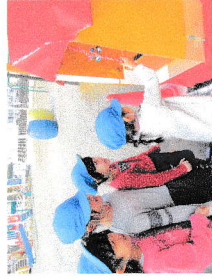
とほく神社お参り