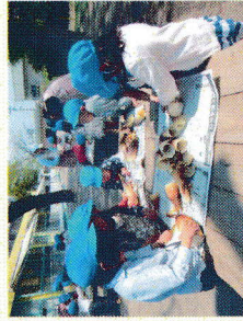
バイキング給食下格え