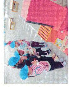
とほく神社お参り