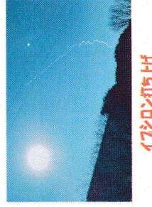
イタロン作り上げ