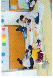
ベビーメッセージ