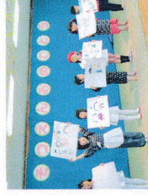
卒園おめでとうパーティ