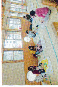
ベビーマッサー教室