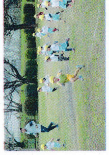
2歳児 たいそう教室