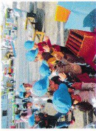
とほく神社お参り