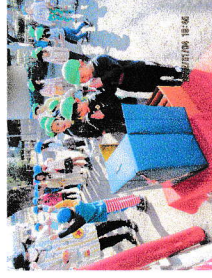
とほく神社お参り