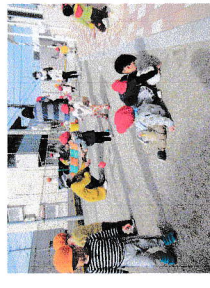
お正月の遊び(分園)