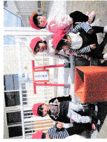
とほく神社お参り(分園)