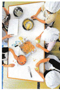
ライオンカレークッキング