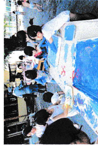
ポティペインティング