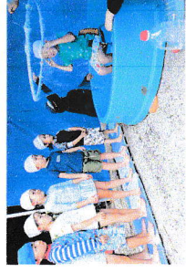
大きなシャボン玉