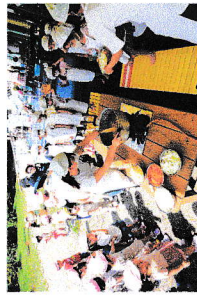
ライオンカレークッキング