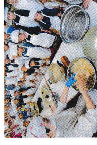
魔法のラーメンクッキング