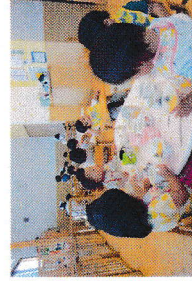
バイキング給食 分園