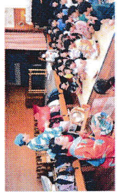
子ども屋さんがやって来た